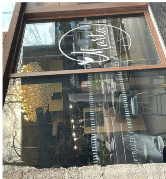
Das Restaurant Marta in den Viaduktbögen