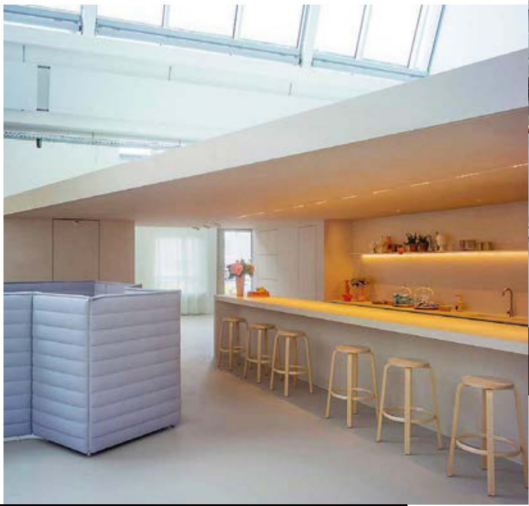
VITRA CAMPUS, Basel

➔ WILLKOMMEN IM CLUB. Dass Vitra Expertise in Sachen Büroausstattung hat, steht außer Frage. Dementsprechend ist es für das Schweizer Unternehmen Pflicht und Kür gleichermaßen, wenn das Unternehmen sein eigenes Bürokonzept auf neue Beine stellt. Das firmiert übrigens unter dem Begriff „Club Office“ und schafft Kreativräume, Rückzugsorte und Treffpunkte für die Belegschaft. Aufgeteilt ist alles in einen