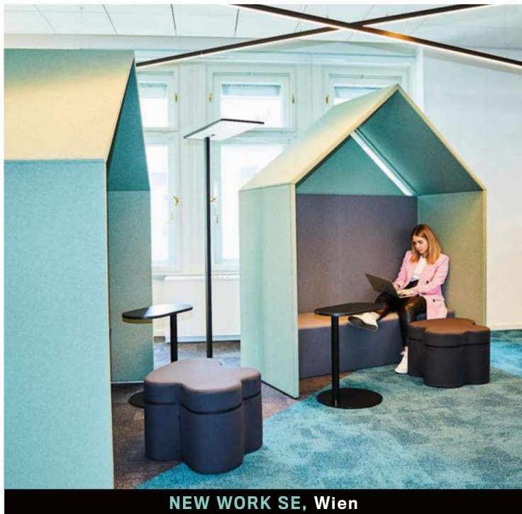
NEW WORK SE, Wien